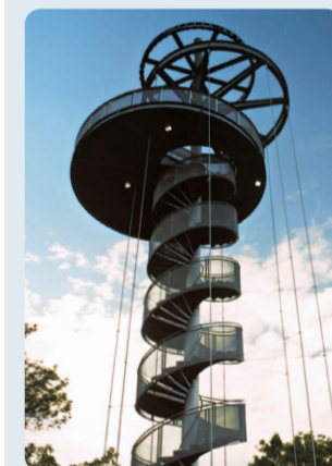
Aussichtsturm am Wingersberg Dietzenbach