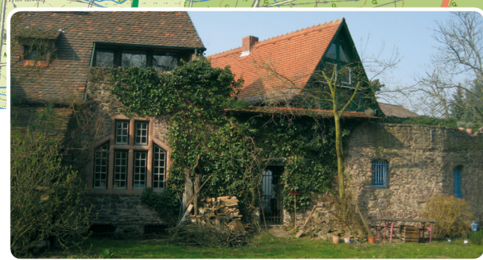
8 Altstadt Dreieichenhain: Gebäuderückseite südlich des Untertores