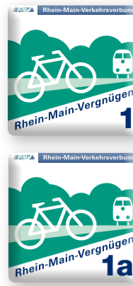
Rhein-Main Vergnügen 1a