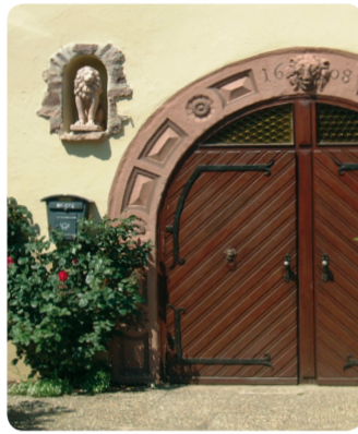
8 Altstadt Dreieichenhain: Treischer Hof