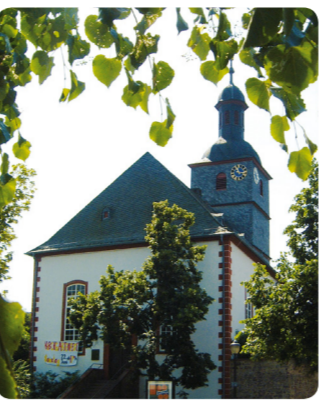
3 Sprendlingen, Lindenplatz