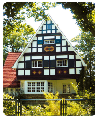
1 Wohnhaus in der Villenkolonie Buchschlag