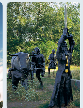
Auf der Bulau: Keltische Begräbniszereemonie, Urberach