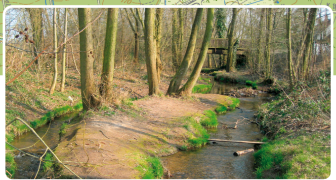
2 Hengstbach zwischen Buchschlag und Sprendlingen