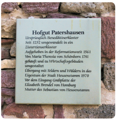
6 Am Hofgut Patershausen