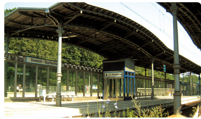
Start- und Zielpunkt: Bahnhof Buchschlag

Rund um Dietzenbach (38 km) mit Regionalparkvariante