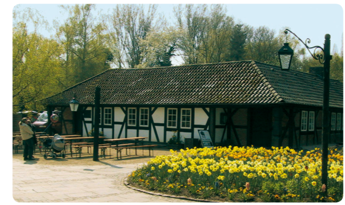
5 Gut Neuhof, Alte Backstube