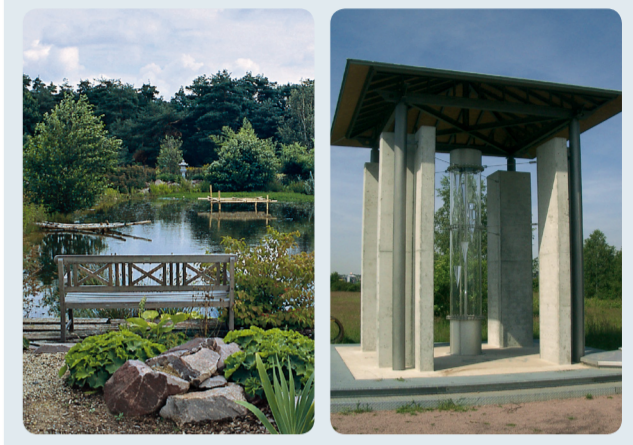
Internetpark (Wörnerpark) Dietzenbach