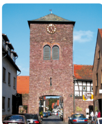
8 Altstadt Dreieichenhain: Obertor