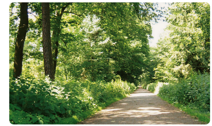
Waldweg zwischen Gut Neuhof und Hofgut Patershausen