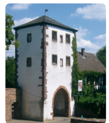
8 Altstadt Dreieichenhain: Untertor