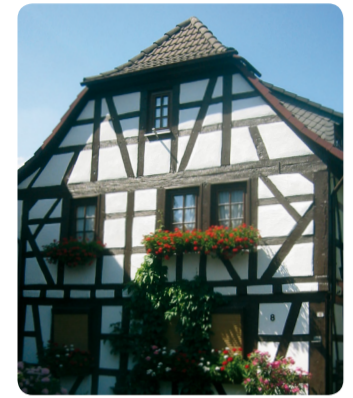
8 Altstadt Dreieichenhain: Fachwerkhäuser Fahrgasse