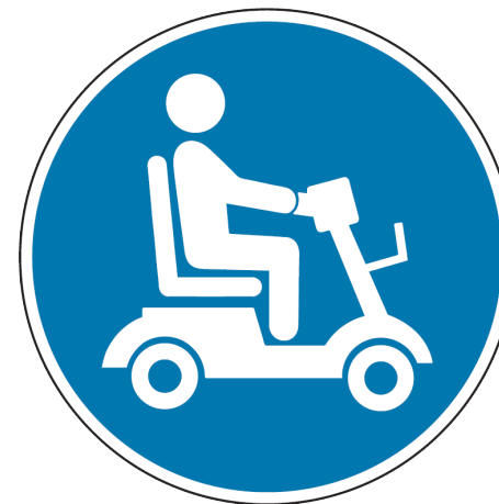
Piktogramm auf geeigneten Fahrzeugen