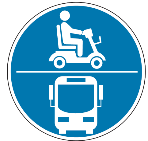
Piktogramm auf geeigneten E-Scootern