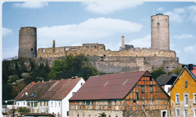
2 Burg Münzenberg