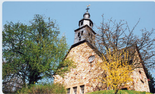
3 Rockenberg: evangelische Kirche