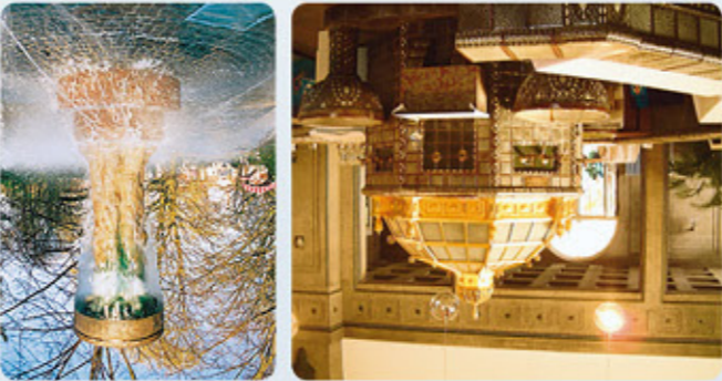
4 Bad Nauheim: Trinkkuranlage 5 Bad Nauheim: Kurpark