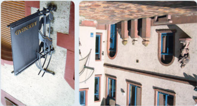
6 Friedberg: Wetterau-Museum 6 Friedberg: Judenbad