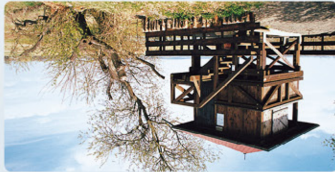
Bingelheimer Fried: Beobachtungsstand