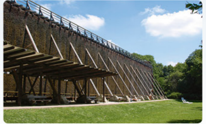
5 Bad Nauheim: Liegewiese am Gradlebau I