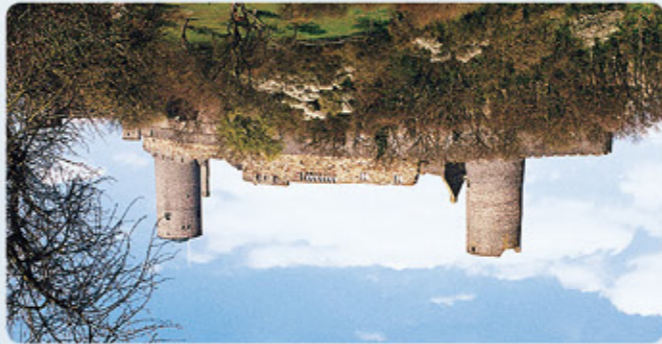
2 Burg Münzenberg