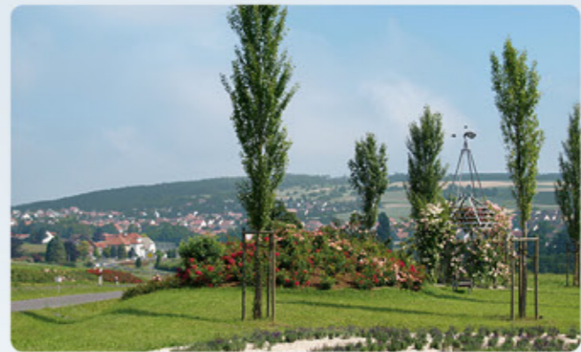
4 Rosenpavillon, im Hintergrund Steinfurth