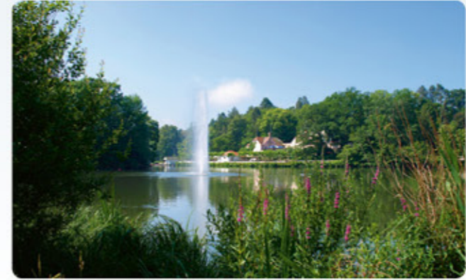
5 Bad Nauheim: Großer Teich