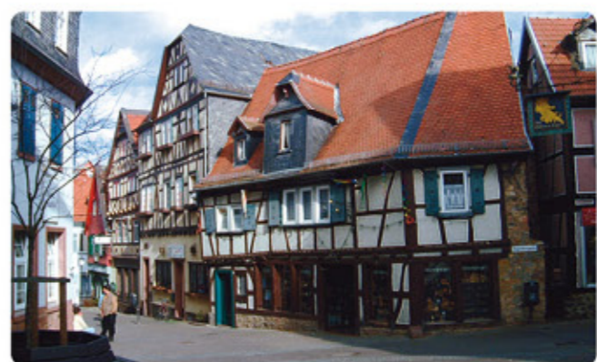
6 Friedberg: Altstadt