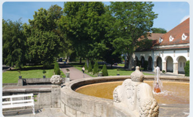
5 Bad Nauheim: Sprudelhof