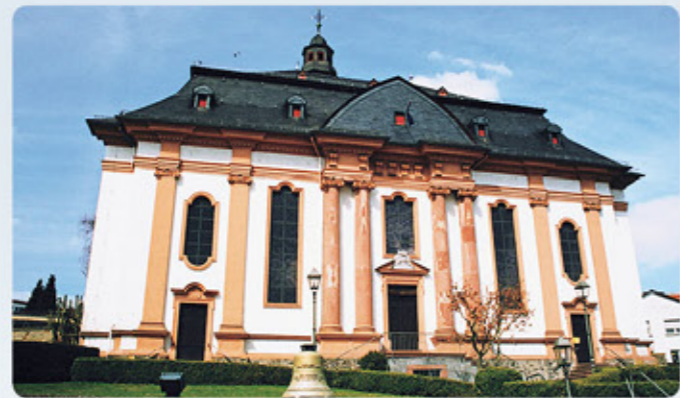
1 Wölfersheim: evangelisch-reformierte Kirche (Saalkirche)