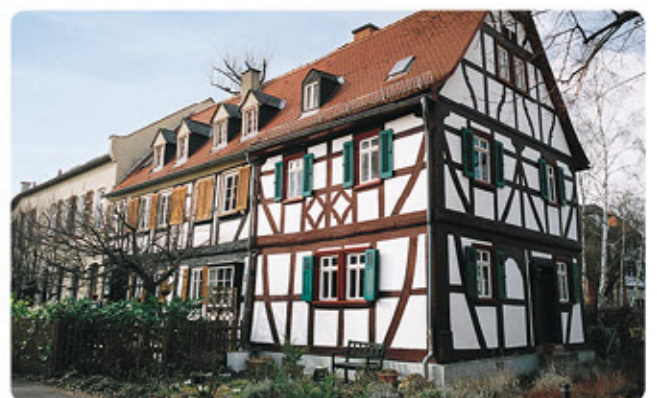
6 Friedberg: Burgmannenhaus