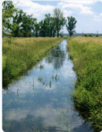
Nähe Bingenheimer Ried

Die Wetterau zwischen Friedberg und Münzenberg (39 km)