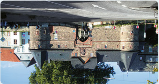
6 Friedberg: Burgtor