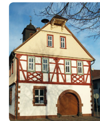
1 Trebur: Altes Rathaus