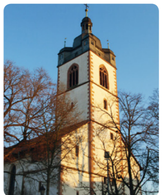
5 Groß-Gerau: Stadtkirche