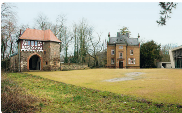
5 Groß-Gerau-Dornberg: Schloss