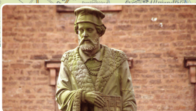
4 Gernsheim: Schöffersdenkmal