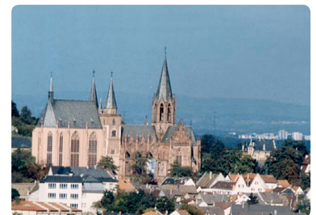
2 Oppenheim: Katharinenkirche