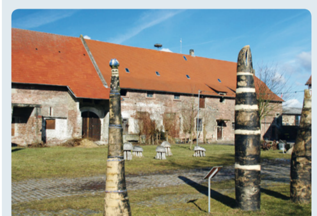
3 Kühkopf: Hofgut Guntershausen