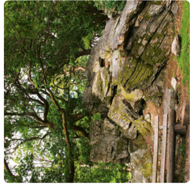
Marmorstein (RMV-Route 6)