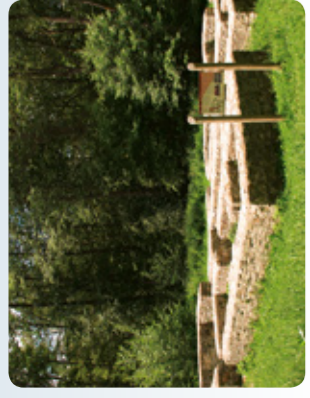
Kapersburg (RMV-Route 2)