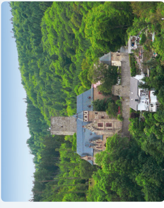
Schloss Kransberg (RMV-Route 2)

Hochtaunus, Karte Süd Entlang der Taunusbahn zwischen Usingen und Bad Homburg