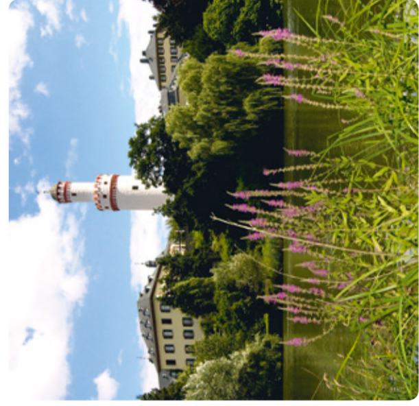
Bad Homburg: Schloss und Schloßgarten (RMV-Routen 1, 2 und 6)