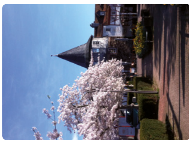
Hofheim am Taunus