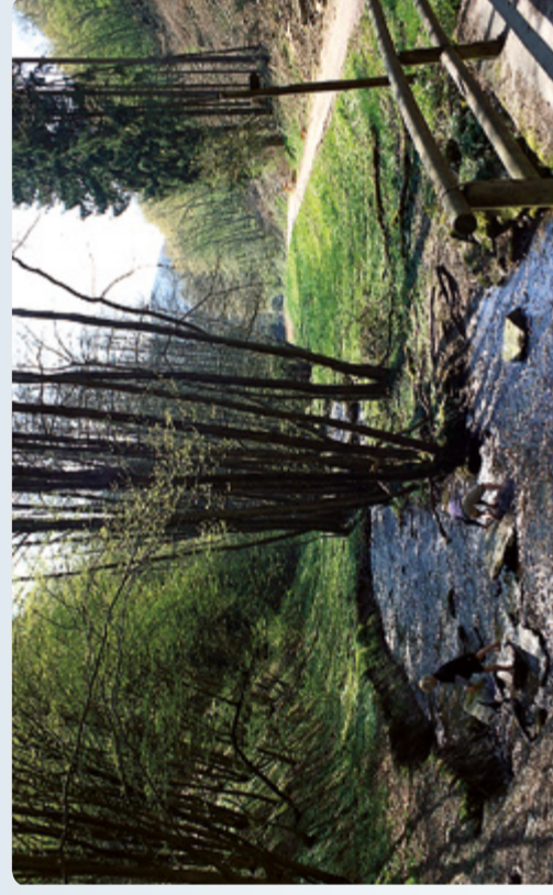
Im Silberbachthal (Route 4)