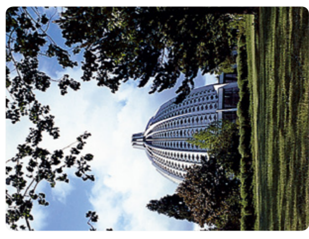
Am Bahai-Tempel (Route 2)