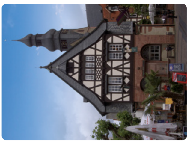
Hofheim am Taunus