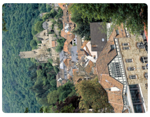
Bannhof und Burg Eppstein