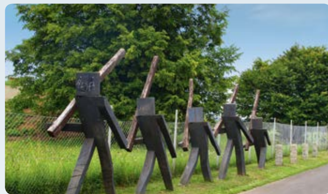
6 Hohe Straße: Wartbaum

Unterwegs zwischen Hoher Straße und Kinzig (52 km)