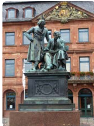
1 Hanau: Brüder-Grimm-Denkmal