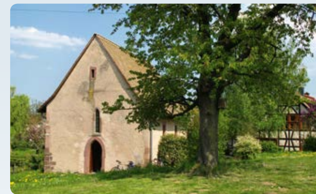
8 Hohe Straße: Hammersbach-Hirzbach, Marienkapelle