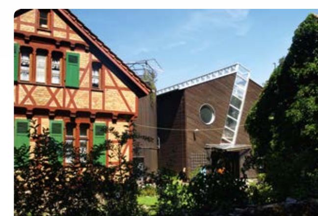
Forstamt Hanau-Wolfgang: Samendarre