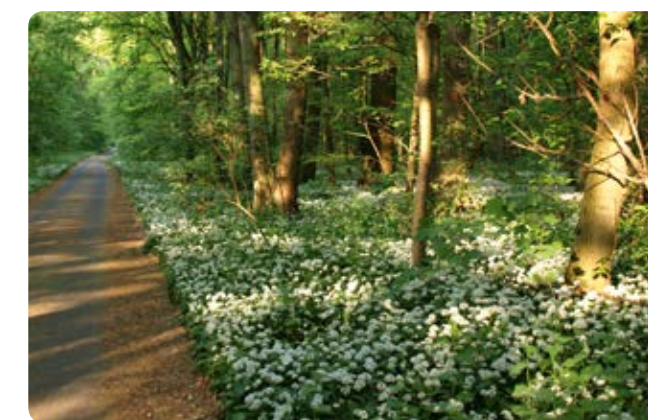
Bärlauchblüte in der Kinzigau