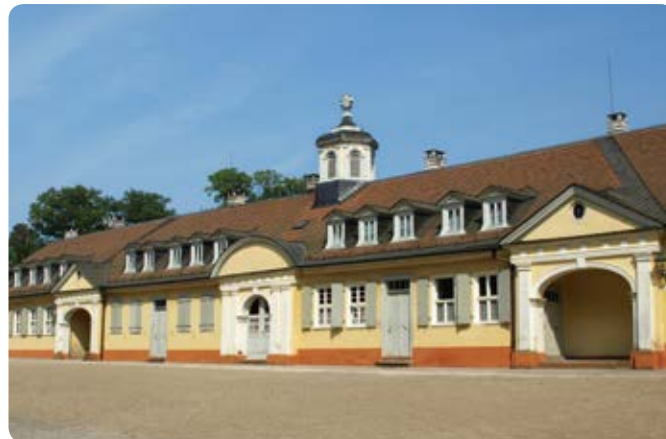
4 Staatspark Wilhelmsbad