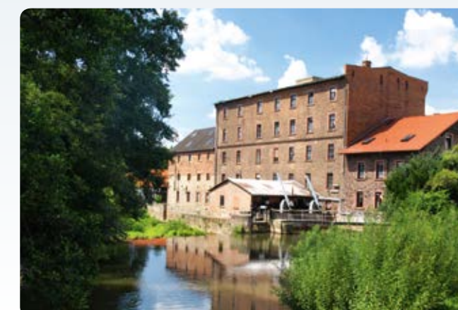
Erlensee-Rückingen: Alte Mühle