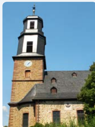
Rodenbach: Ev. Pfarrkirche