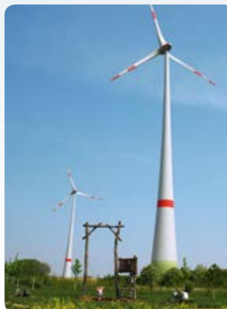
5 Hohe Straße: Galgenberg