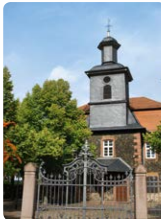
3 Hanau-Kesselstadt: Reinhardskirche