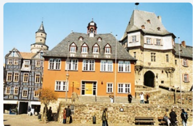
1 Idstein: „Schiefes Haus“, Hexenturm, Rathaushaus und Torbogengebäude