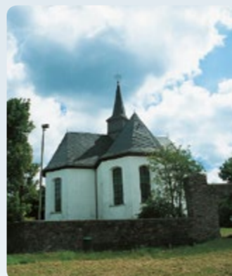
3 Bad Camberg: Kreuzkapelle