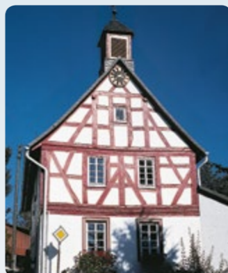
Dombach: altes Rathaushaus