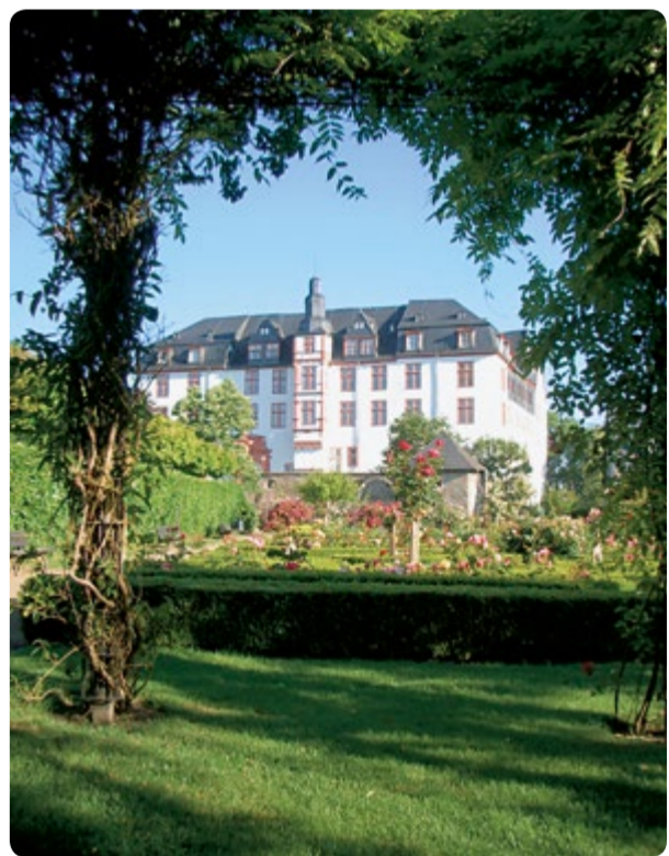
Idstein: Schloss mit Renaissancegarten