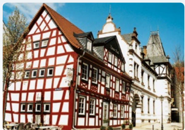
Idstein: Am Marktplatz