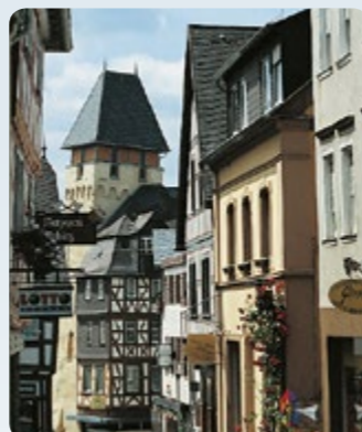
Bad Camberg: Unterturm: „Schiefer Turm“