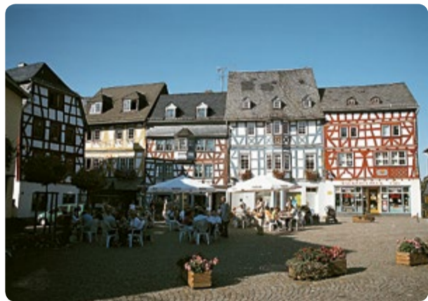
4 Bad Camberg: Marktplatz