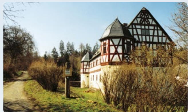
2 Weilrod: Eichelbacher Hof