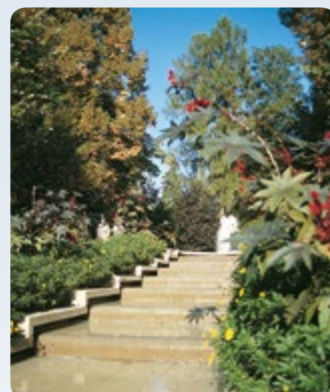
4 Bad Camberg: Kurpark

Durch den Taunus bei Idstein und Bad Camberg (40 km)