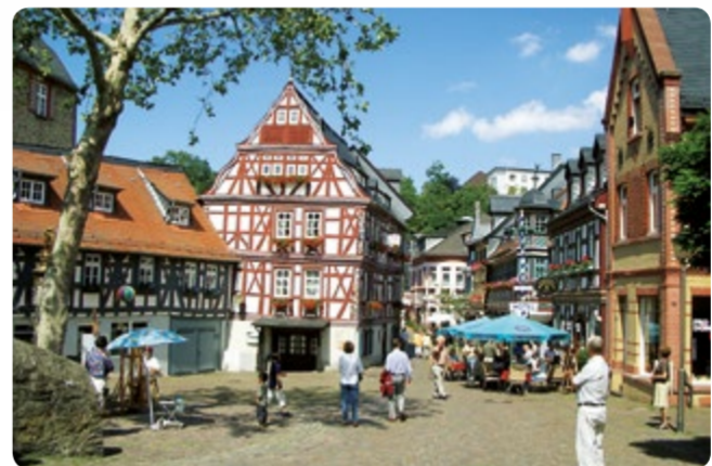
Idstein: Historische Altstadt