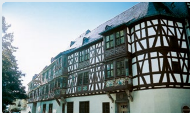
Bad Camberg: Amthof