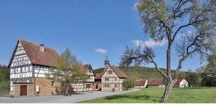
Fränk. Freilandmuseum Fladungen