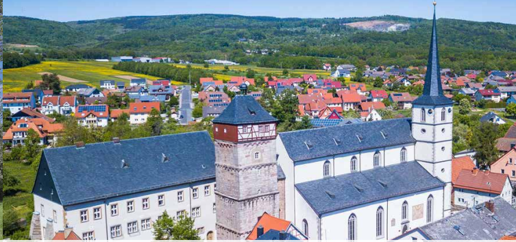
Blick auf Bischofsheim i. d. Rhön